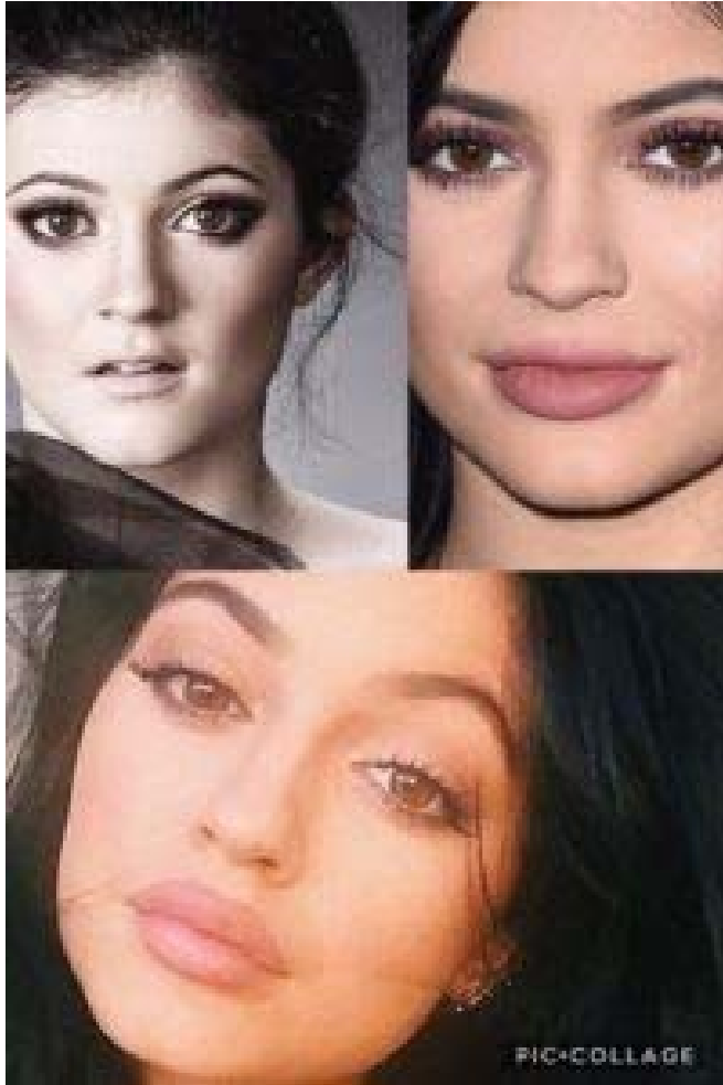
Une fille, trois bouches, un genre assumé